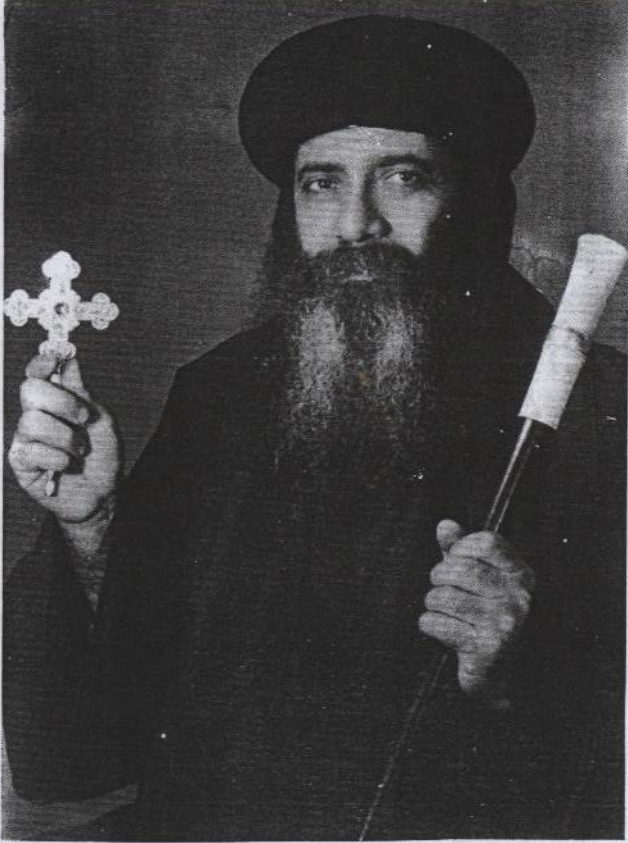
قداسة البابا المعظم الأنبا شنودة الثالث